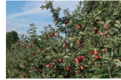
山口騰果樹園 りんご畑