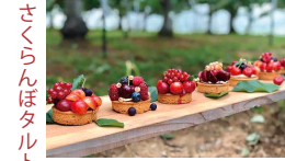
さくらんぼタルト