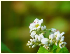
そばの花は見頃にご案内いたします