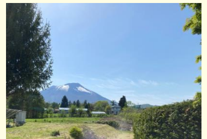
ユートランド姫神からのぞむ岩手山 ※写真はすべてイメージです。

●盛岡市中心部からお車でお越しの場合 国道4号、国道282号を經由 分れ交差点から 約13分