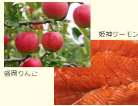
盛岡りんご 姫神サーモン ガレットには盛岡産食材を使用!