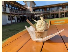
温泉ジェラートの割引もありますよ